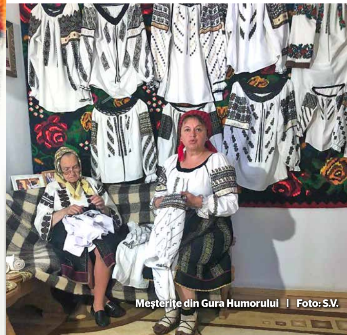
Mășterite din Gura Humorului