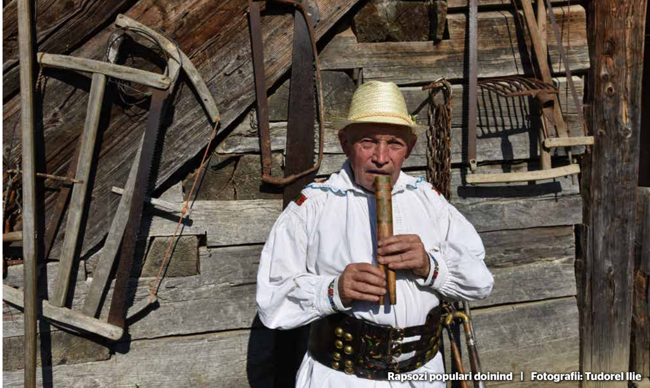
Rapsozi populari doinind