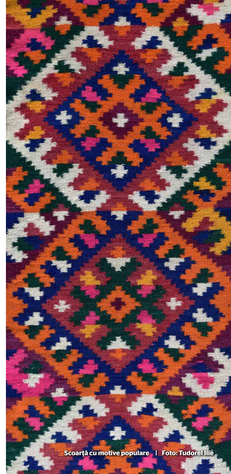
Scoarță cu motive populare