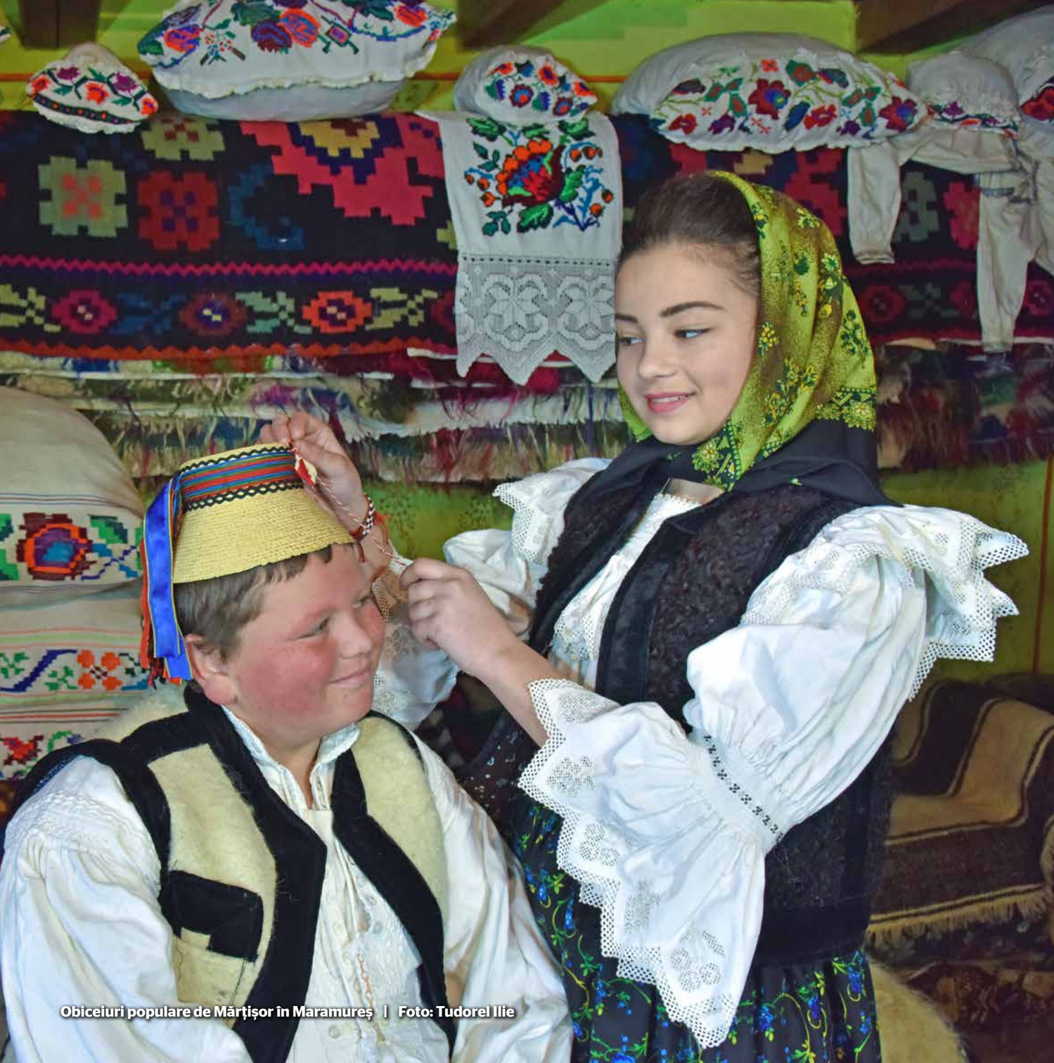
Obiceiuri populare de Mărțișor în Maramureș | Foto: Tudorel Ilie