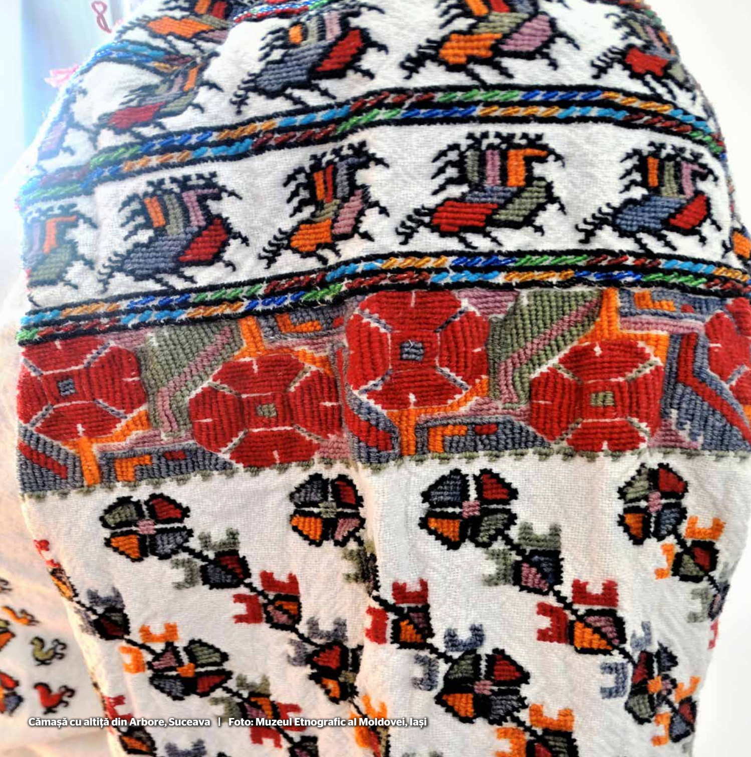
Cămașă cu altiță din Arbore, Suceava

Conform calendarului actual, dosarul de nominalizare depus de România și Republica Moldova va fi evaluat în cadrul celei de-a 17-a sesiuni a Comitetului Interguvernamental pentru Salvagardarea Patrimoniului Cultural Imaterial, la sfârșitul anului 2022.