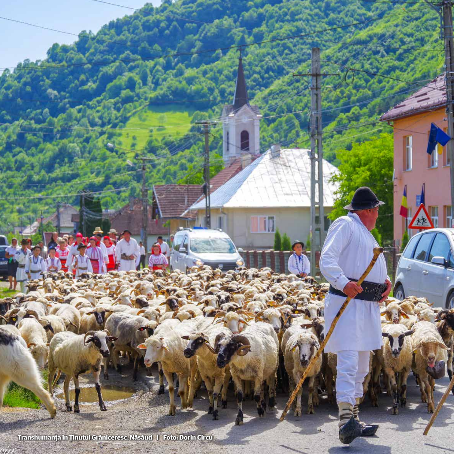
Transhumanța în Ținutul Grăniceresc, Năsăud