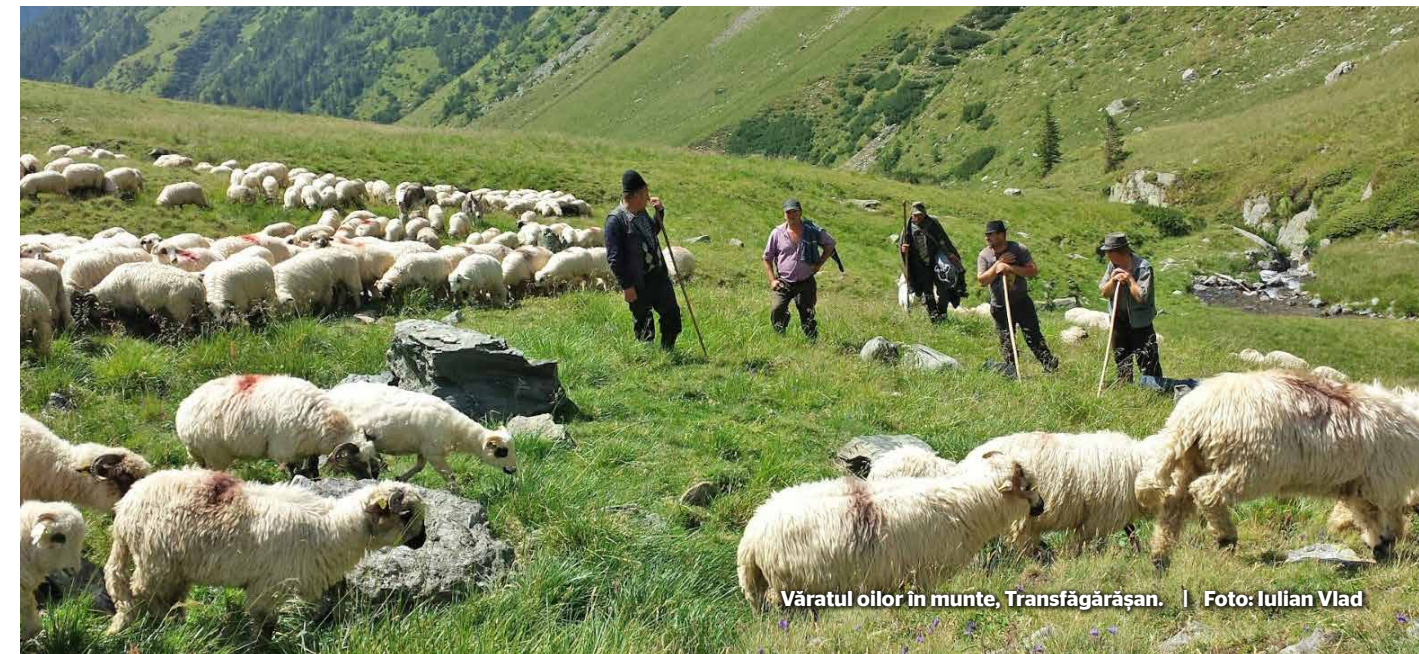
Văratul oilor în munte, Transfăgărășan.

Tradiția transhumanței, veche de mii de ani, este o practică importantă a păstoritului încă din timpul Imperiului Roman și Evul Mediu. Constă în deplasarea sezonieră a turmelor de vite între locurile de văratic, în general în zonele de relief cu pășuni bogate, și locurile de iernatic, în general în zonele de șes și cu climă mai blândă iarna. Printre țările unde această practică are loc, pot fi menționate Scoția, Caucazul, Ciadul, Marocul, Franța, Italia, Irlanda, Islanda, Libanul, România, Republica Moldova, Bulgaria, Grecia, Spania, Iranul, Turcia, Macedonia de Nord, India, Elveția, Georgia și Lesotho. Este practică și de poporul nomad sami din Scandinavia, care își mută renii parțial domesticiți între regiuni. Astfel se presupune că originea transhumanței se găsește în migrațiile naturale ale animalelor sălbatice care stau la baza speciilor domestice create de om. Începând cu anii 1970, în Norvegia, circa 15.000 de reni sunt transportați anual cu vase de debarcare către pașiștile de vară pe insule sau pe locuri greu accesibile altfel.