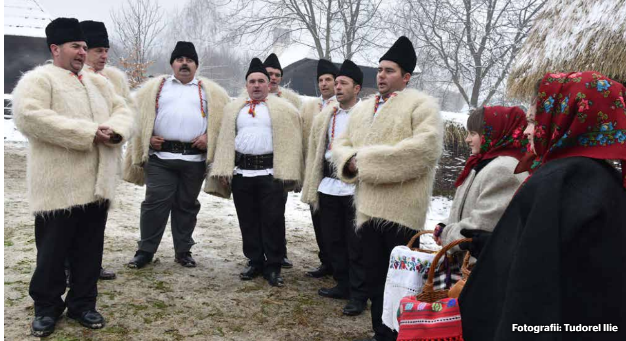
Fotografii: Tudorel Ilie