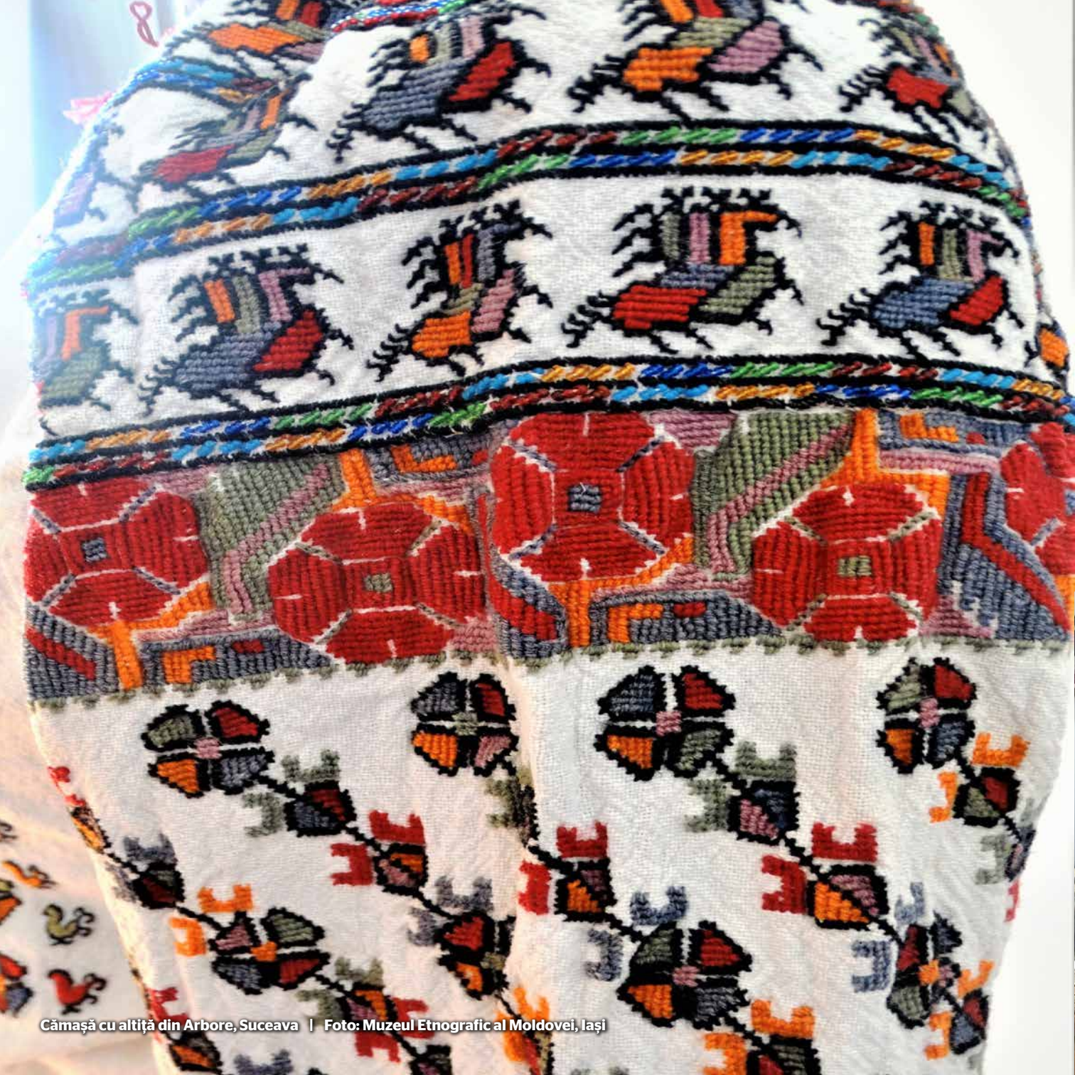
Cămașă cu altiță din Arbore, Suceava