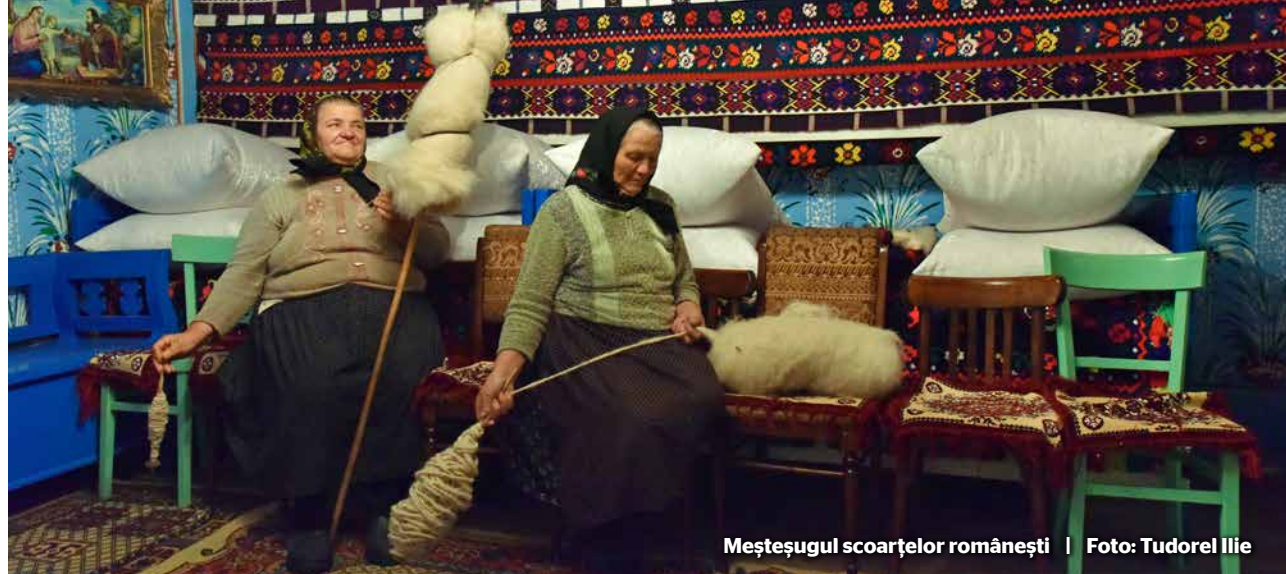
Meșteșugul scoarțelor românești