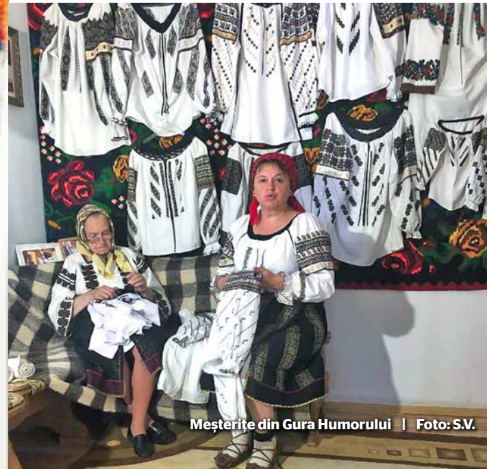
Mășterite din Gura Humorului