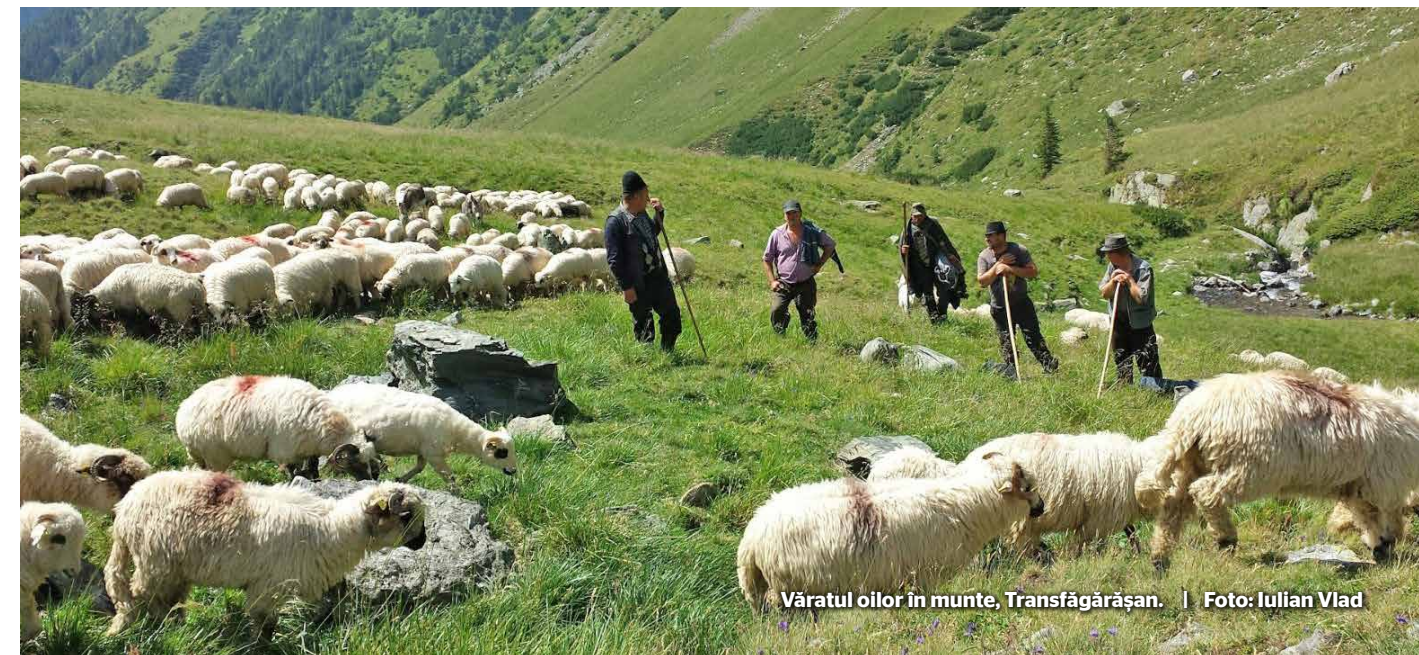
Văratul oilor în munte, Transfăgărășan.

Tradiția transhumanței, veche de mii de ani, este o practică importantă a păstoritului încă din timpul Imperiului Roman și Evul Mediu. Constă în deplasarea sezonieră a turmelor de vite între locurile de văratic, în general în zonele de relief cu pășuni bogate, și locurile de iernatic, în general în zonele de șes și cu climă mai blândă iarna. Printre țările unde această practică are loc, pot fi menționate Scoția, Caucazul, Ciadul, Marocul, Franța, Italia, Irlanda, Islanda, Libanul, România, Republica Moldova, Bulgaria, Grecia, Spania, Iranul, Turcia, Macedonia de Nord, India, Elveția, Georgia și Lesotho. Este practică și de poporul nomad sami din Scandinavia, care își mută renii parțial domesticiți între regiuni. Astfel se presupune că originea transhumanței se găsește în migrațiile naturale ale animalelor sălbatice care stau la baza speciilor domestice create de om. Începând cu anii 1970, în Norvegia, circa 15.000 de reni sunt transportați anual cu vase de debarcare către pașiștile de vară pe insule sau pe locuri greu accesibile altfel.